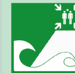
Panneau du point de rassemblement