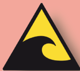
Panneau de la zone à évacuer